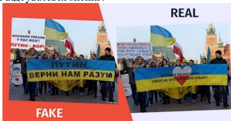
Рисунок 2 – Фейкова та оригінальна світлини

Усі категорії, які зазначалися вище, нагадують нам створення новин на рашистських каналах. Саме рф використовує усі ці методи. Наприклад, у лютому 2023 року в інтернет потрапила новина із заголовком «У Польщі відбувся мітинг, де українці просили у путіна «повернути їм здоровий глузд», а внизу прикріплене фото, де справді відбувається мітинг.