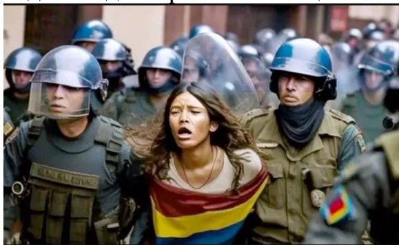
Рисунок 2 – Одна зі згенерованих ШІ візуалізацій протестів у Колумбії

Проте ці зауваження стосуються не лише українських посадовців, контент-мейкерів і комунікаційників. Зокрема, 30 квітня 2023 р. норвезька філія міжнародної правозахисної організації Amnesty International опублікувала у Twitter серію зображень, які ілюстрували доповідь організації до другої річниці масових протестів у Колумбії через підвищення податків під час пандемії COVID-19, коли влада вдалася до жорсткого поліцейського насильства (рис. 2).