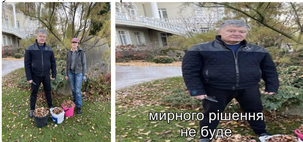
Рисунок 3 – Мем щодо Петра Порошенка

до будь-чого. Навіть зі звичайного фото суспільство може зробити різні мему, які стануть хвилею для нових жартів.