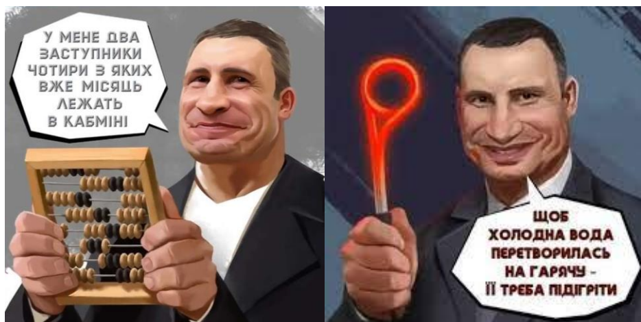
Рисунок 1 – Мемі, які стосуються Віталія Кличка

мемах відображається як нерозумного очільника, що каже речі, які і так очевидні або нелогічні, незрозумілі (рис. 1).