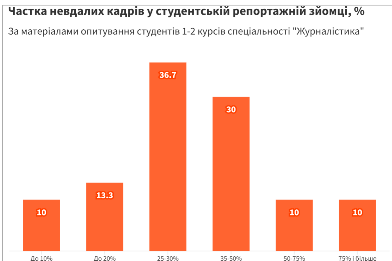
Рисунок 3 – Частка невдалих кадрів у студентській репортажній зйомці

Основні помилки у репортажній зйомці представлено на рис. 4. Найпоширенішими є помилки експозиції фотографії (перекспонований або недоекспонований кадр – ймовірність помилки зростає за умов використання ручного режиму (М) – див. рис. 2), після них – помилки проєкції фону, коли під час зйомки не зауважують усі деталі. Наступними за поширеністю є помилки балансу, композиції, кадрування, фокусування тощо. Помилки у роботах колег зауважують де-що частіше, ніж у власних.